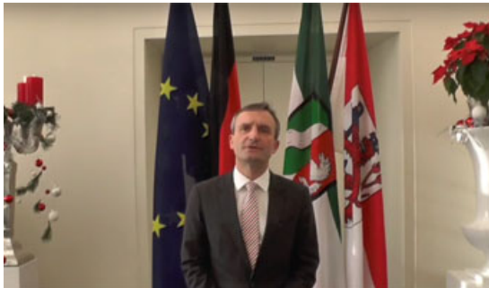
年頭挨拶する Geisel 市長

今年はノルトライン=ヴェストファーレン州（州都=デュッセルドルフ市）発足 70 周年となり、当市で 8 月 26 日-28 日まで「NRWデー」という市民祭を開催予定で、100 万人の来場者を見込んでいます。また 2016 年のハイライトの一つとして、例年通り今年も「日本デー」を 5 月 21 日に開催します。